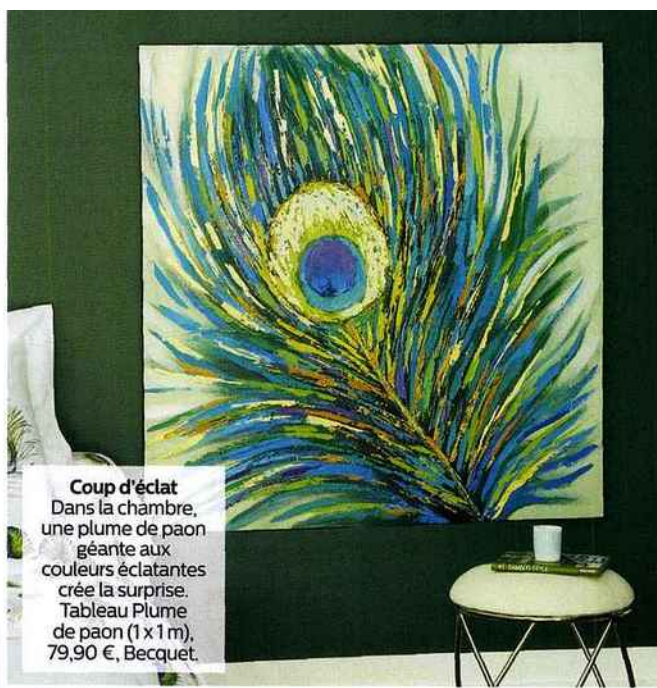
Coup d'éclat Dans la chambre, une plume de paon géante aux couleurs éclatantes crée la surprise. Tableau Plume de paon (1 x 1 m), 79,90 €, Becquet.